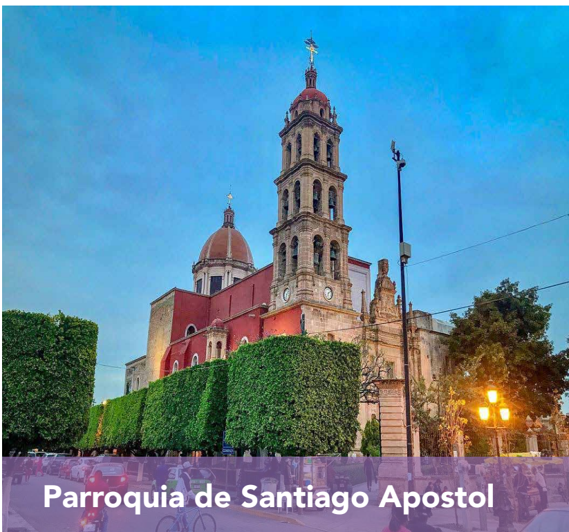
Parroquia de Santiago Apostol

A 19.9 km del hotel 🚗 17 min 🚶 2 h 2 min