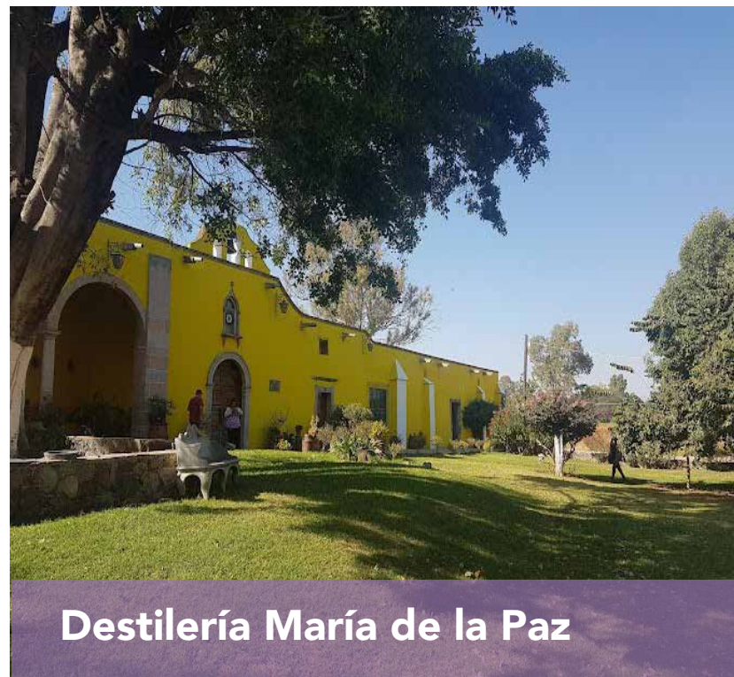
Destilería María de la Paz

A 12.8 km del hotel. 🚗 13 min 🚶 2 horas 26 min