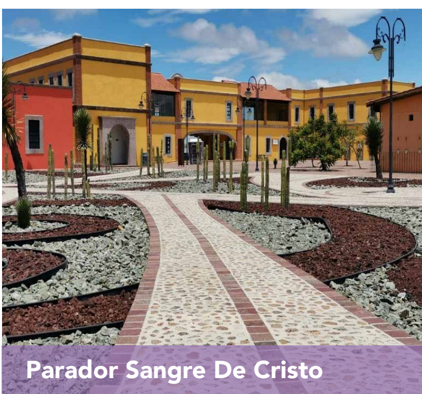
Parador Sangre De Cristo

A 22.6 km del hotel. 🚗 43 min 🚶 3 horas 52 min