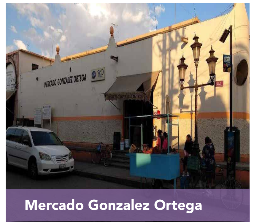
Mercado Gonzalez Ortega