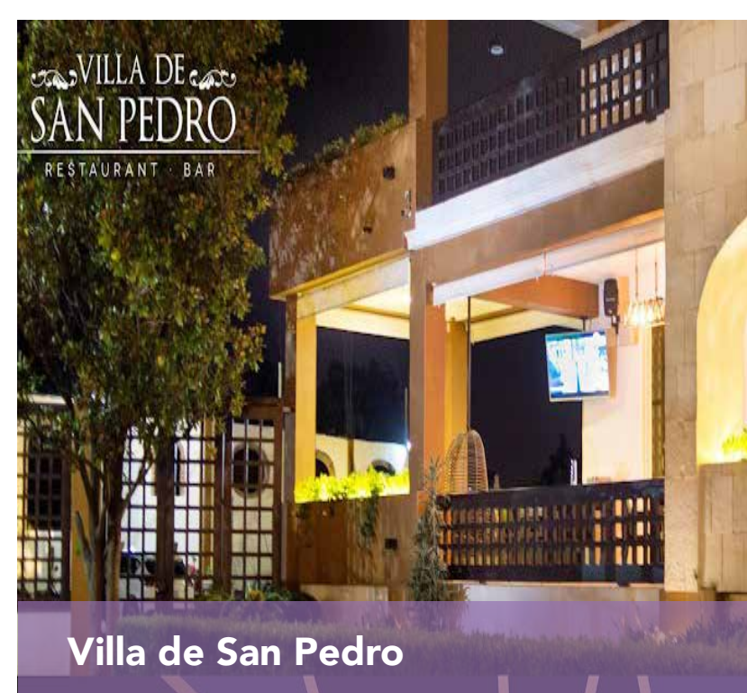
Villa de San Pedro