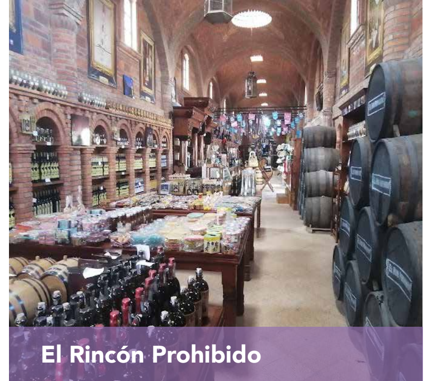
El Rincón Prohibido

A 6.6 km del hotel 🚗 13 min 🚶 1 h 18 min