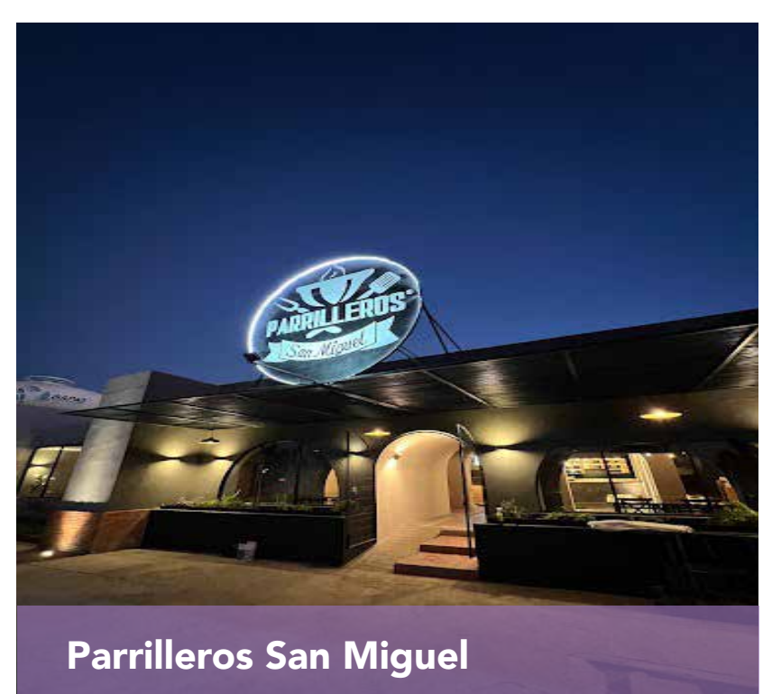
Parrilleros San Miguel