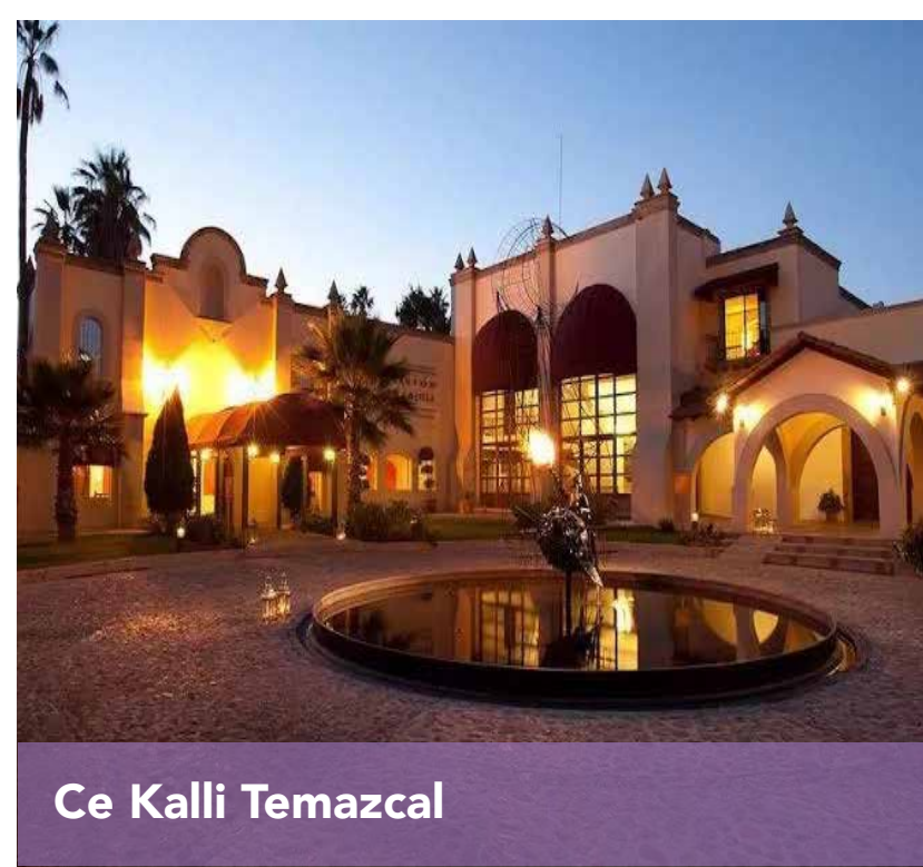
Ce Kalli Temazcal

A 25.3 km del hotel. 🚗 23 min 🚶 4 horas 13 min