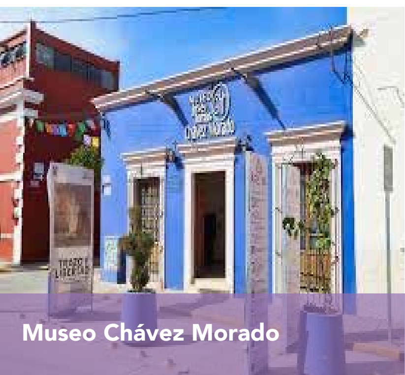
Museo Chávez Morado