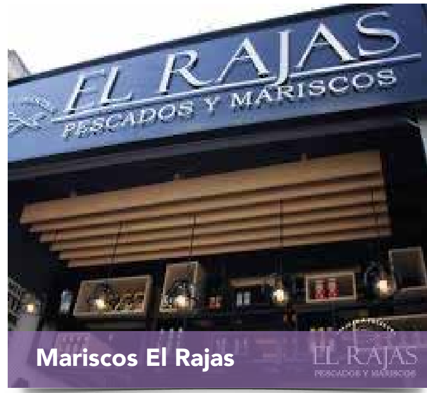
Mariscos El Rajas