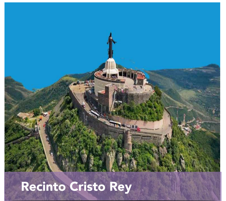
Recinto Cristo Rey

A 25.3 km del hotel. 🚗 23 min 🚶 4 horas 13 min